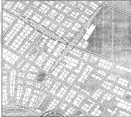
المخطط التفصيلى لمدينة السنبلوين

يتم تعديل عرض الشارعين رقمى ( ١ ، ٢ ) من عرض ( ١٠ ) أمتار إلى ( ٦ ) أمتار ليتوافق مع ما هو قائم على الطبيعة حفاظاً على الملكيات الخاصة ، مع الالتزام بتطبيق الاشتراطات البنائية والتخطيطية الواردة بالمخطط التفصيلى المعتمد للمدينة وأحكام القانون رقم ١١٩ لسنة ٢٠٠٨ ولائحته التنفيذية وتعديلاتها ، وذلك بما لا يتعارض مع المخطط الاستراتيجى المعتمد للمدينة كما هو موضح بالرسم .