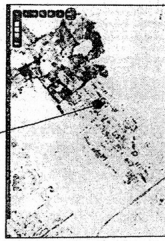
موقع المخطط بالنسبة للمدينة

وزارة التخطيط، والموارد المائية والري، والهيئة العامة للغيازة موجهة بالاسم: المخطوطات الهندسية